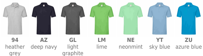
94 heather grey AZ deep navy GL light graphite LM lime NE neonmint YT sky blue ZU azure blue